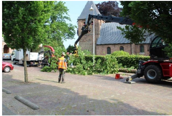
Op 8 juni is door de Overhaag de kastanjeboom gekapt.