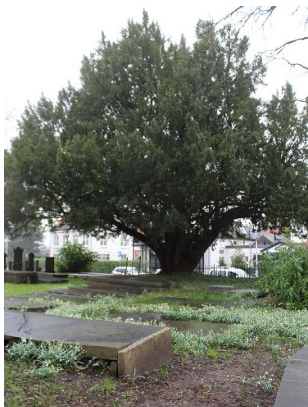
De eeuwenoude taxus is door de Bomenstichting opgenomen in het Landelijk Register van Monumentale bomen