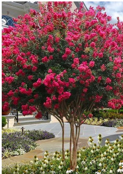
In eigen beheer is er een Lagerstroemia indica Tuscarora voor terug geplant